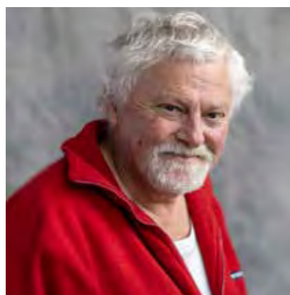
Dhr. J.D. Hogendoorn lid, voor de doelgroep ouderen