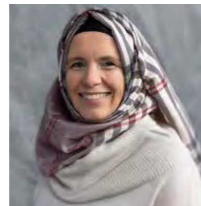
Mw. Y. Tel beleidsmedewerker