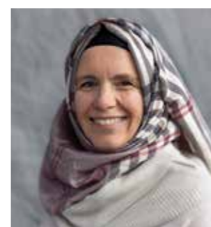
Mw. Y. Tel beleidsmedewerkster